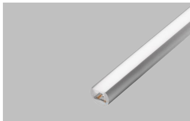
Tableau de compatibilité LEDs/profils disponible sur demande.

Set 2x clips de montage, plastique, transparent, inclus 2 vis